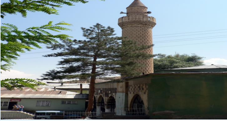
Hacı Şeref Camii