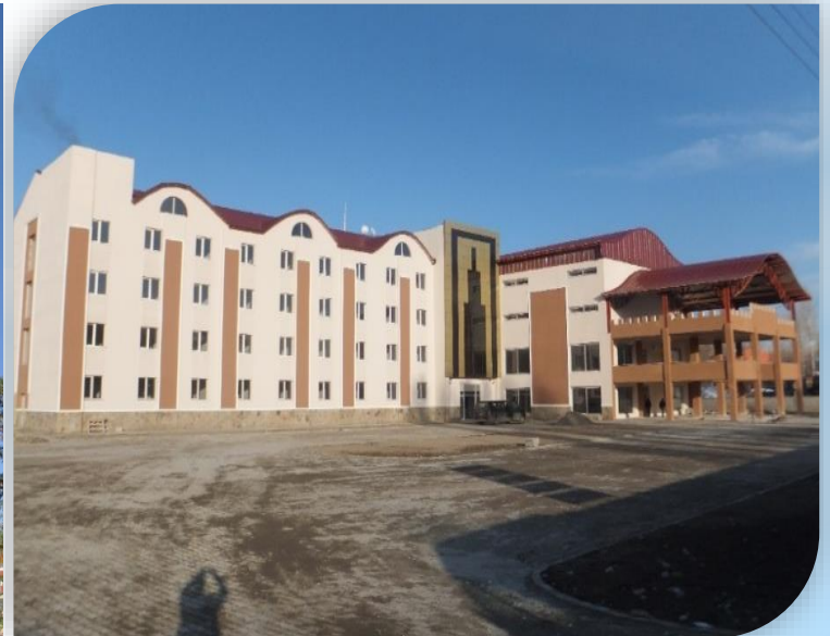
2014 yılında hizmete giren Merkez 178 yataklı ve Malazgirt 100 Yataklı Öğretmen Evleri