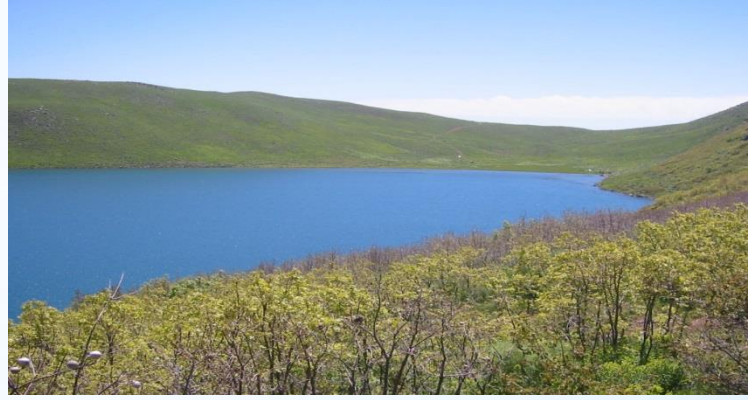
Küçük Hamurpet Gölü