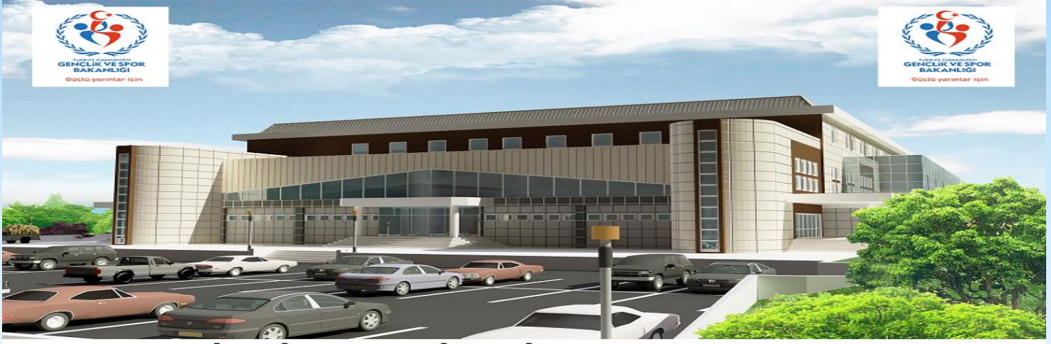
1500 SEYİRCİ KAPASİTELİ MERKEZ SPOR SALONU