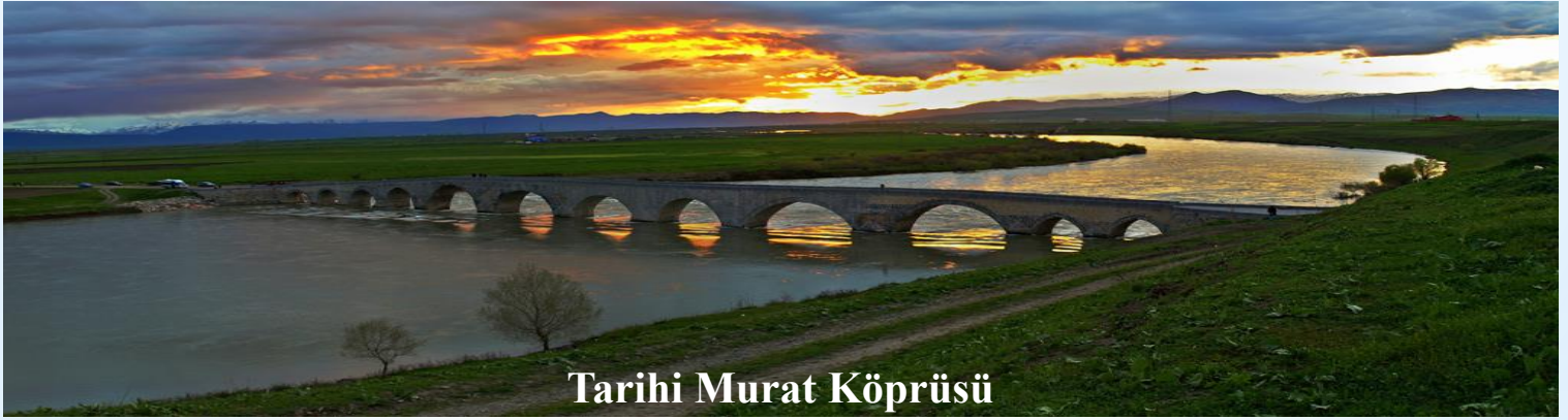
Tarihi Murat Köprüsü