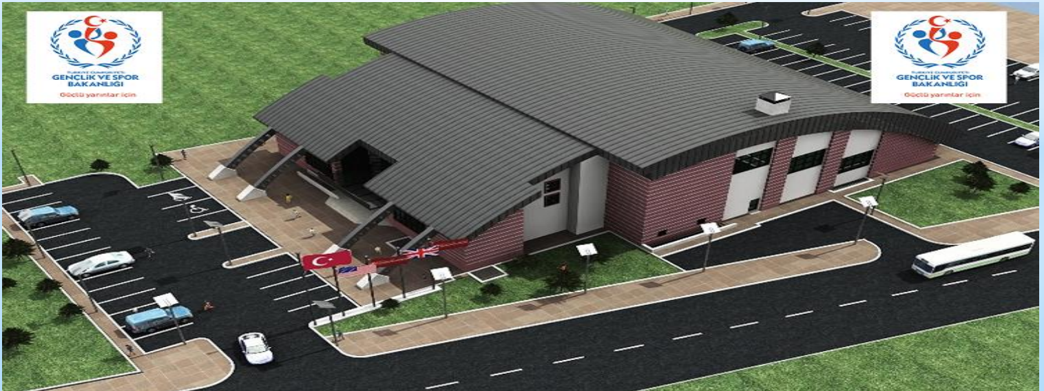
500 SEYİRCİ KAPASİTELİ MERKEZ KAPALI YÜZME HAVUZU

Bu yıl temeli atılan 1.500 seyirci kapasiteli Spor Salonu ve 500 Kişilik Kapalı Yüzme Havuzunun yapımları tüm hızıyla devam etmektedir.