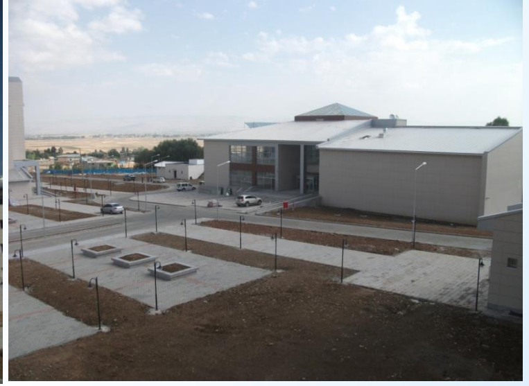
2014 Yılında hizmete giren 1028 kişilik KYK Yurdu