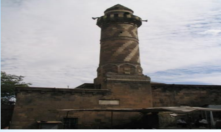
Alaattin Bey Camii