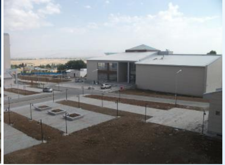
2014 Yılında hizmete giren 1028 kişilik KYK Yurdu