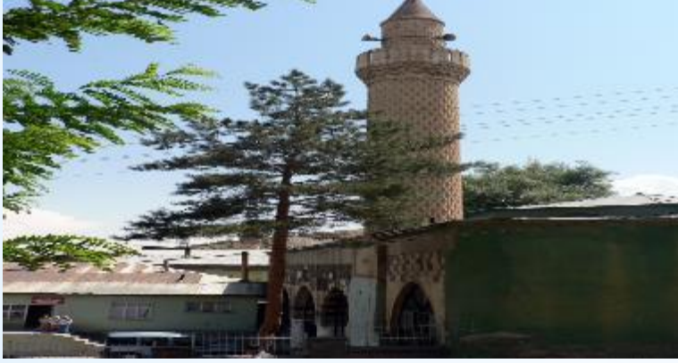
Hacı Şeref Camii