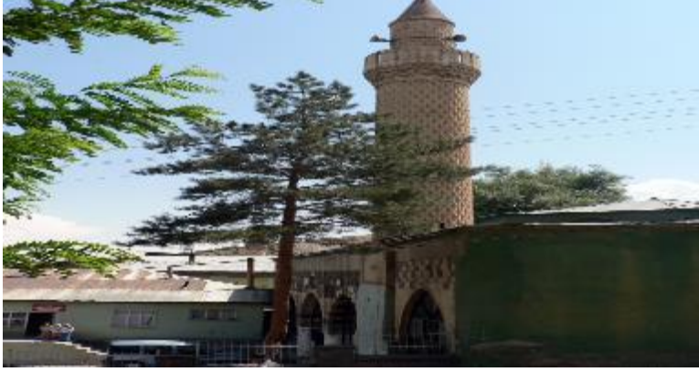
Hacı Şeref Camii