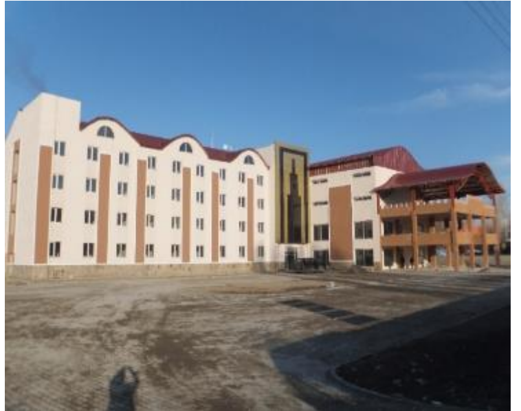
2014 yılında hizmete giren Merkez 178 yataklı ve Malazgirt 100 Yataklı Öğretmen Evleri