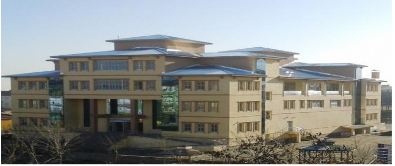
2015 yılında hizmete giren Aile ve Sosyal Politikalar Hizmet Binası