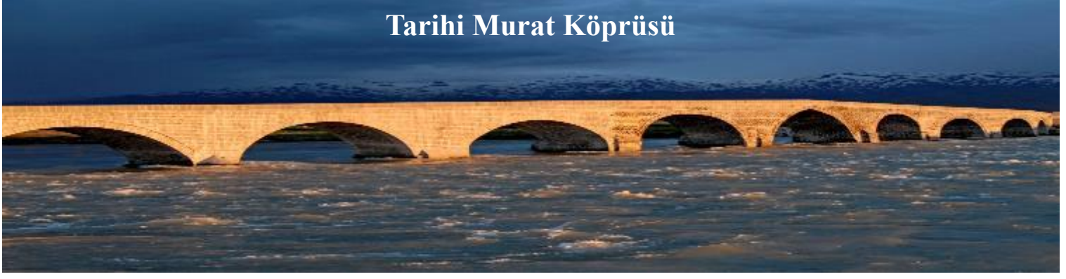
Tarihi Murat Köprüsü