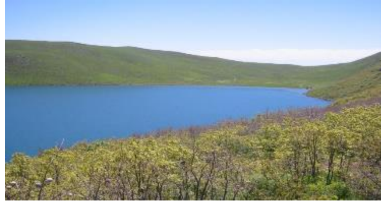
Küçük Hamurpet Gölü