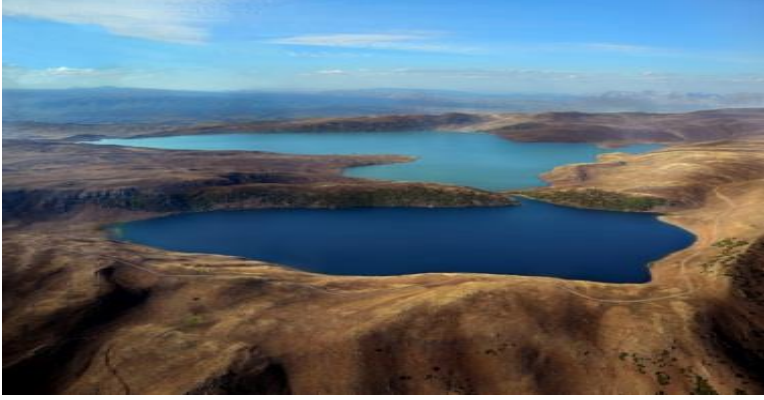
Büyük Hamurpet Gölü