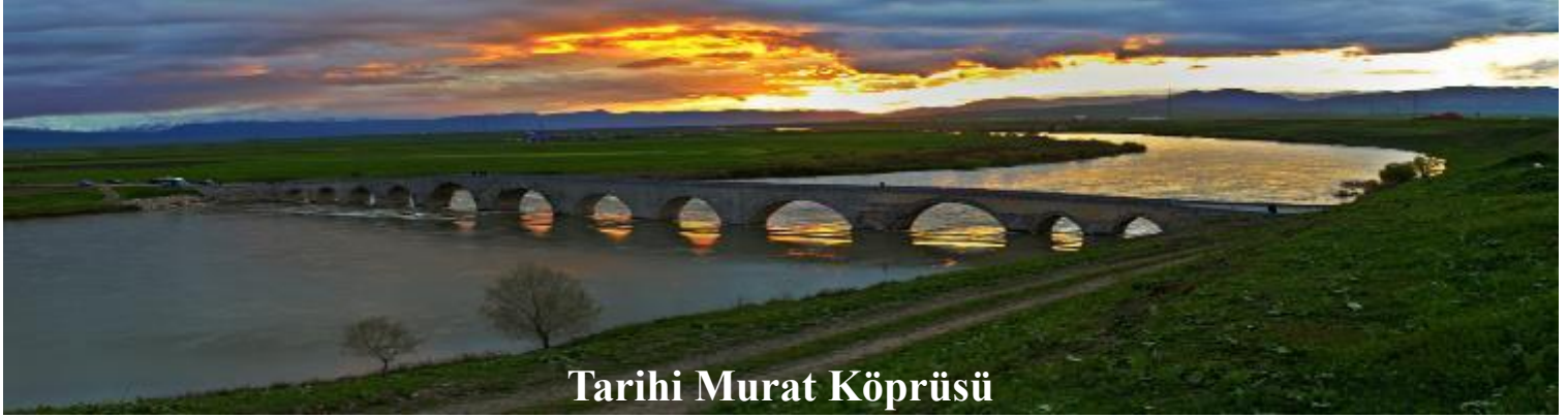
Tarihi Murat Köprüsü