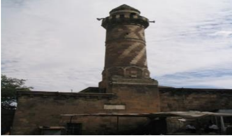
Alaattin Bey Camii