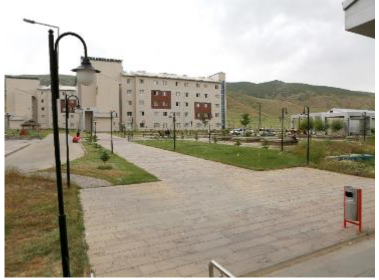
2014 Yılında hizmete giren 1028 kişilik KYK Yurdu